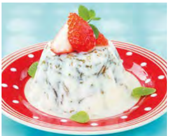
長壽藻牛奶果凍 受到牛奶與鮮奶油的融合感 把長壽藻變成好好健康好吃的甜心