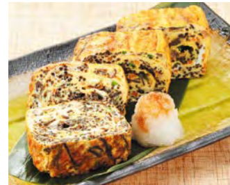
日式長壽藻卷蛋 有很多配料的雞蛋卷蛋 當然可以當成早餐 更是便當的小菜，晚餐的主菜也很好