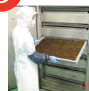
沖洗・篩選・品質管理 乾淨的長壽藻（水雲）加以乾燥加工，除去異物。