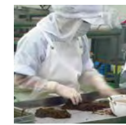
※沖洗和篩選重複2次。