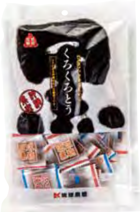
琉球黒糖株式会社 琉球黒糖(特濃) 在沖繩の黒糖著名品牌“琉球黒糖”中最受歡迎の口味就非特濃黒糖莫屬，非常適合作為沖繩伴手禮。