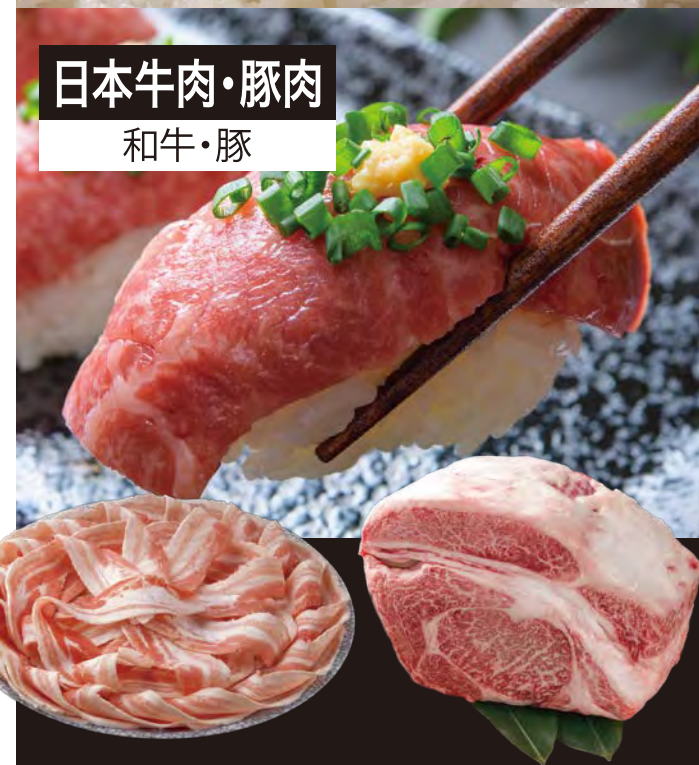
日本牛肉・豚肉 和牛・豚