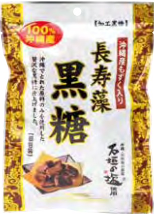
株式会社新垣通商 長壽藻黒糖 含有長壽藻の黒糖放入口中略有香味是色香味俱全の商品