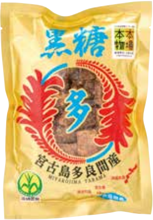
宮古製糖株式会社 多良間黒糖 吸收了多良間島太陽精華の甘蔗製成の黒糖