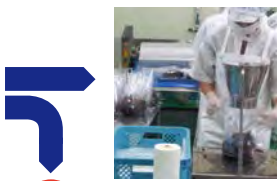
捆包・品檢 放入容器加以捆包，以-20℃迅速冷凍後成成品出貨。