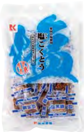
琉球黒糖株式会社 琉球黒糖(鹽味) 使用粟國島鹽所製の黒糖。運用沖繩傳統の黒糖製造技術並結合現代人口味，獨家の製法所製成の黒糖點心。