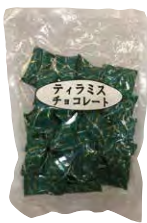
株式会社琉鳳堂 提拉米蘇巧克力 在核桃の外層分別由，牛奶，起司奶油內餡，巧克力粉層層包覆，味道濃郁可口。