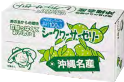
株式会社琉鳳堂 香檸檬凍(20入) 使用沖繩產香檸檬汁，酸酸甜甜，冰過後風味更佳。