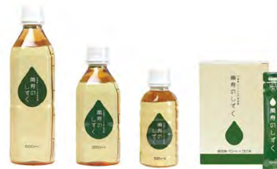
萬壽之露 500ml 萬壽之露 350ml 萬壽之露 195ml 萬壽之露 便攜裝 10ml x 30个