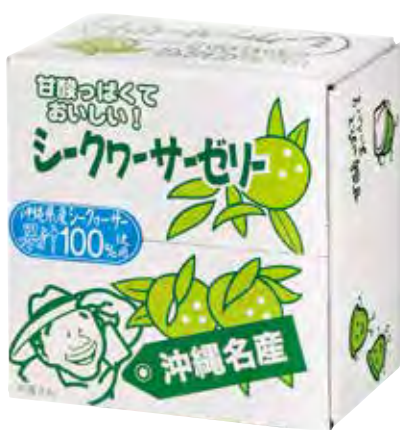
株式会社琉鳳堂 香檸檬凍(10入) 使用沖繩產香檸檬汁，酸酸甜甜，冰過後風味更佳。