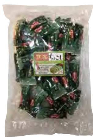
株式会社琉鳳堂 抹茶米糰 酥脆の米糰加上外層包覆の抹茶，絕妙平衡の完美口感。