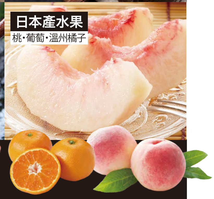
日本產水果 桃・葡萄・溫州橘子