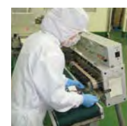
切斷・包裝・品檢 將產品切割成適當大小，且加以包裝成製品。