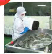
沖洗・篩選・除菌 材料的長壽藻（水雲）更加沖洗・篩選，用臭氣水加以除菌。