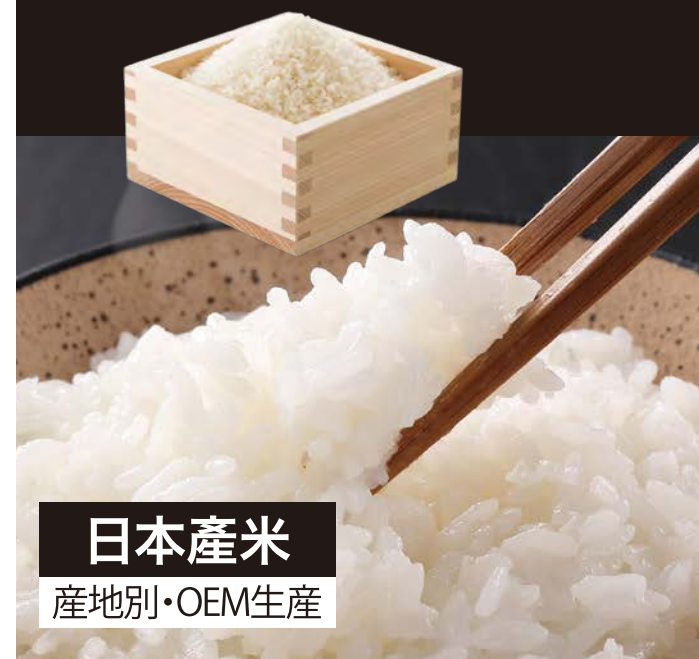
日本產米 產地別・OEM生產