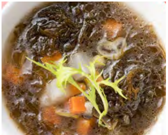
長壽藻蔬菜湯 用在冰箱裡有的蔬菜就可煮成好喝的湯 請享受含有充分維他命，礦物質的湯