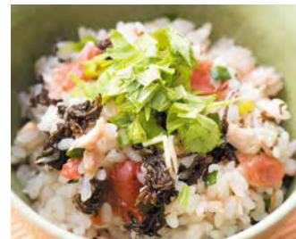
真好吃的長壽藻飯 QQ 的清爽的很健康！ 只要將配料跟米放在電飯鍋裡一起煮就好了