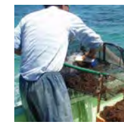
卸貨・檢量 將生鮮長壽藻（水雲）測量重量後送往加工廠。

以下過程是為了說明而簡略化。經過多次沖洗和篩選，且在過程中為保持品質而有多次檢查關卡。