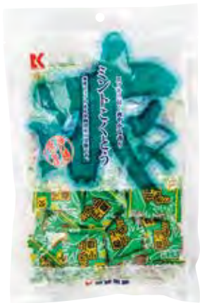
琉球黒糖株式会社 琉球黒糖(薄荷) 琉球黒糖中人氣NO.1。清新爽口的味道讓人無時無刻皆能放鬆心情。