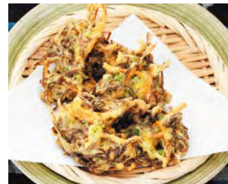
長壽藻天婦羅 在沖繩天婦羅的主要材料就是長壽藻 長壽藻配上酥酥脆脆的面衣口感真好