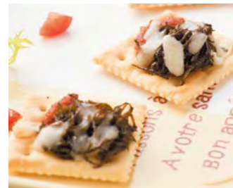
長壽藻 de 披薩 只有乾燥長壽藻才有的用法 把長壽藻當成零食或小菜 很簡單的一品