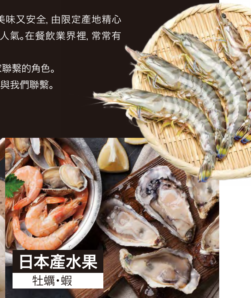
日本產水果 牡蠣・蝦