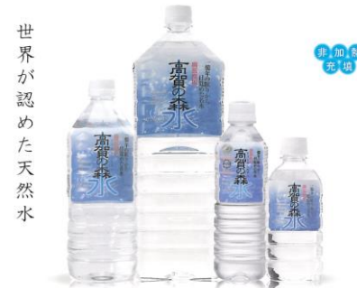
世界が認めた天然水